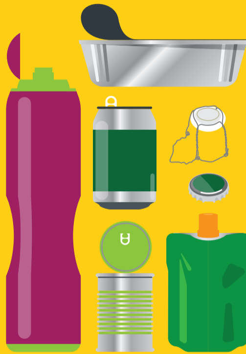
Emballages métalliques boîtes de conserve, barquettes aluminium, bouteilles de sirop, aérosols, canettes