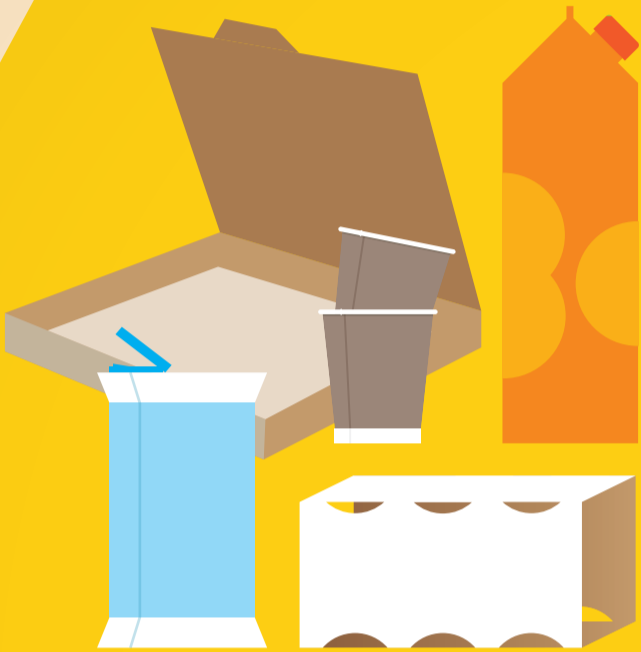
Emballages et briques en carton